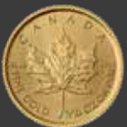
Maple Leaf, American Eagle, Krügerrand, Wiener Philharmoniker 1/10 oz (3,11 g)