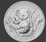
Kookaburra/Koala 1 kg