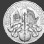
Wiener Philharmoniker 1 oz (31,10 g)