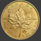
Maple Leaf 1 oz (31,10 g)