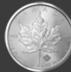
Maple Leaf 1 oz (31,10 g)