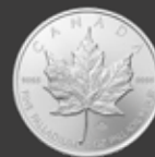
Maple Leaf 1 oz (31,10 g)