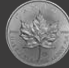
Maple Leaf 1 oz (31,10 g)